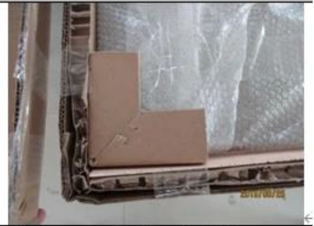
Corner protection/bubble bag/side protection ↵