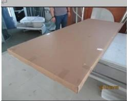
Export carton front view ↵