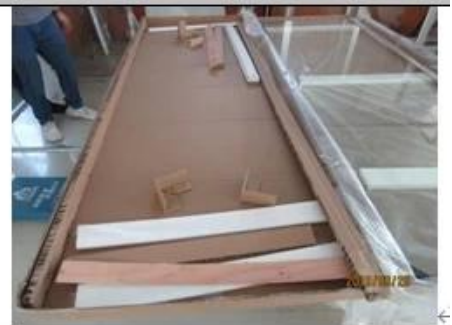
Packing materials ↵