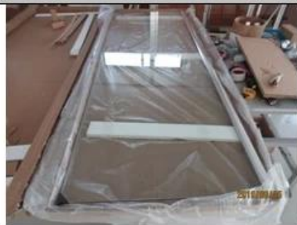
Packing view, Glass packed in ↵