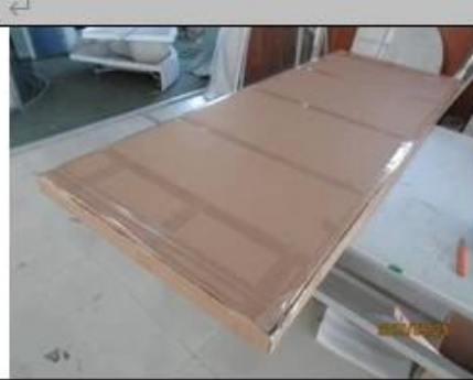
Export carton back view ↵