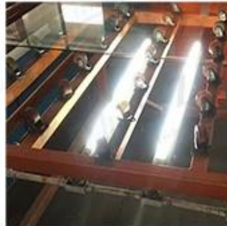
LED Lighting Detection