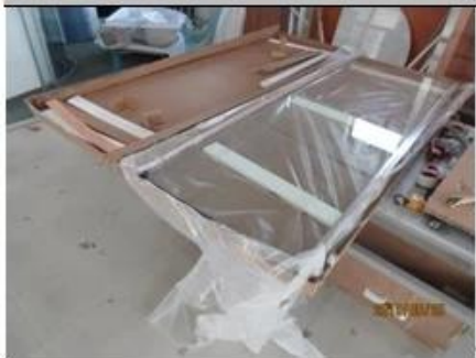
Packing view ↵