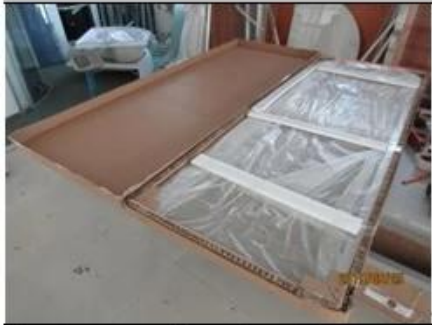
Carton opening view ↵