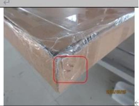
Sealing with glue tape and metal staples ↵