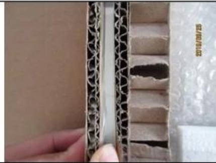
5-ply cardboard ↵