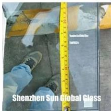
Shenzhen Sun Global Glass