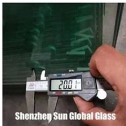
Shenzhen Sun Global Glass