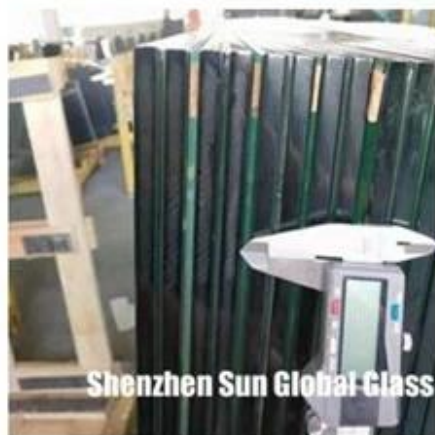
Shenzhen Sun Global Glass