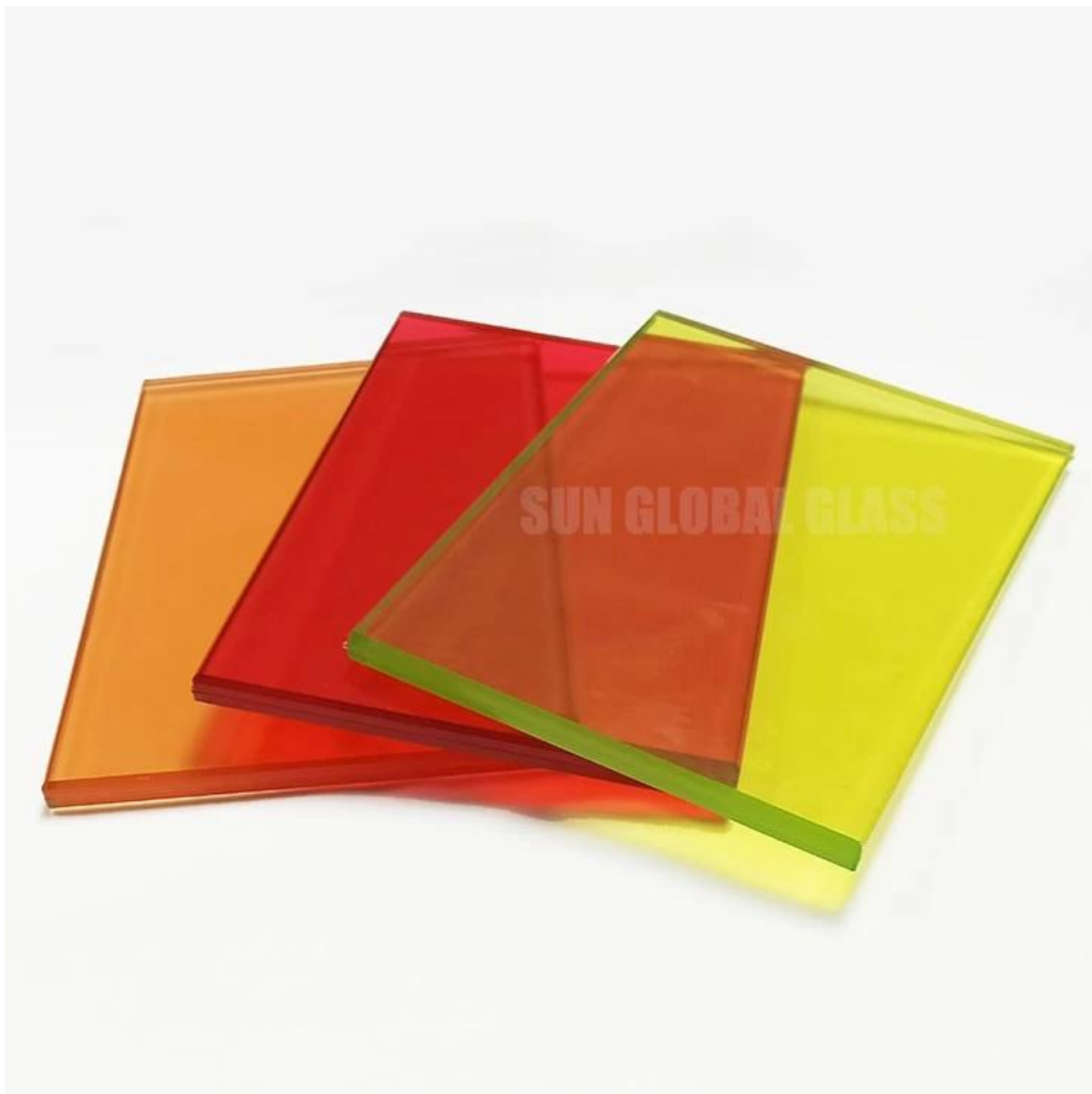
Application de verre feuilleté trempé coloré