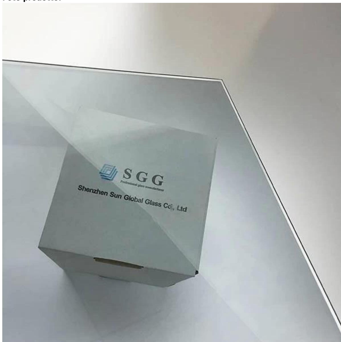
Pacchetto di 10,38 mm vetro low-e laminated: