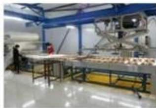
合片室设备 Clean Room Equipment