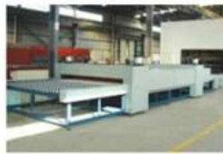
预压机 Pre-pressing Machine