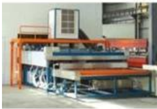
清洗烘干机 Washing and Drying Machine