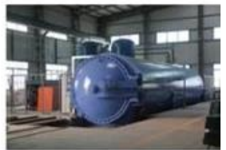
玻璃高压釜 Glass Autoclave