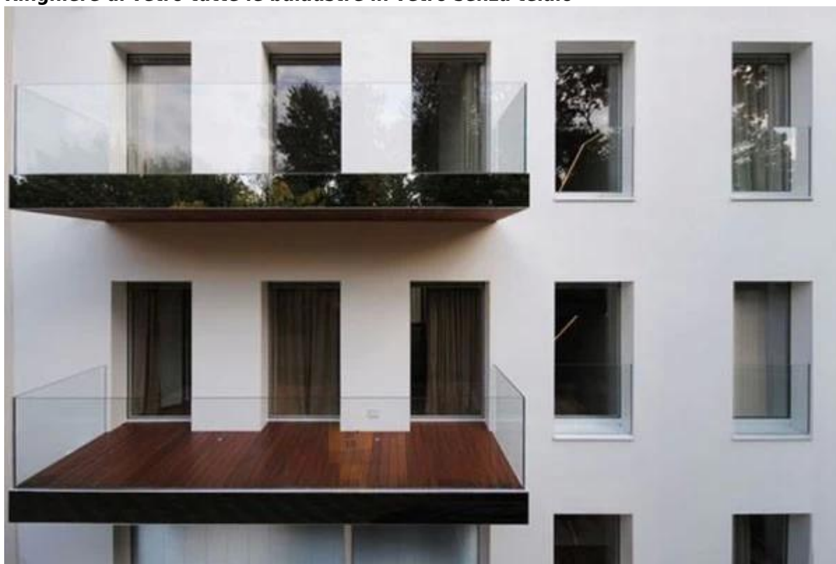
accessories di balaustre di vetro frameless