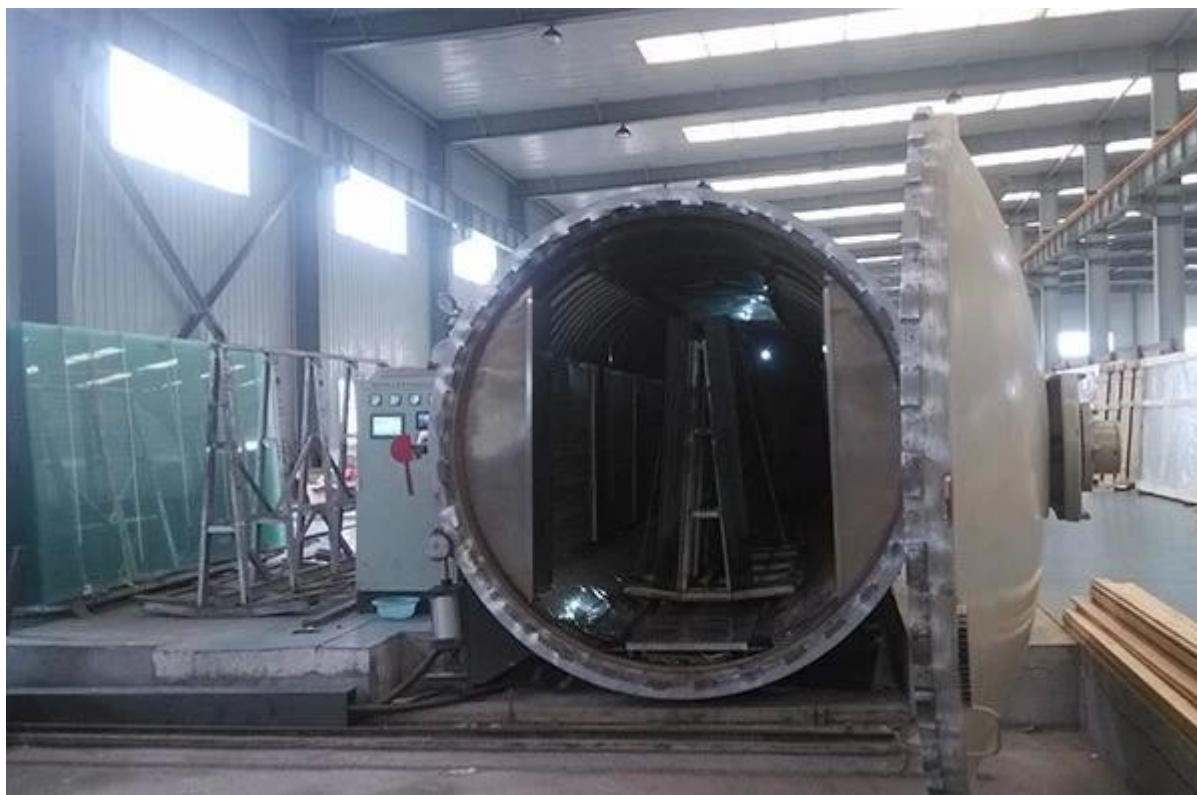
Pacchetto e carico: