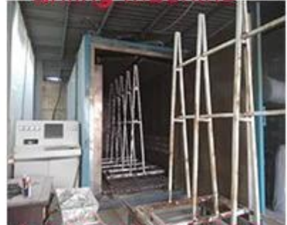
heat soak machine