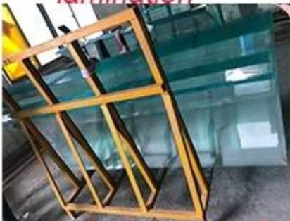
product come out