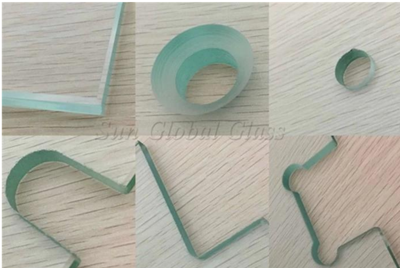
Immagine di vetro stratificato temprato ultra chiaro da 32,28 mm:

Tutti i processi come i fori di perforazione, il bordo di lucidatura, gli angoli di arrotondamento, i ritagli, le tacche di taglio, ecc. Devono essere confermati prima della produzione.