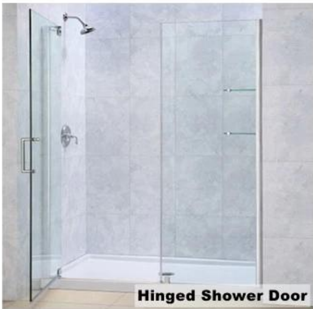
Hinged Shower Door