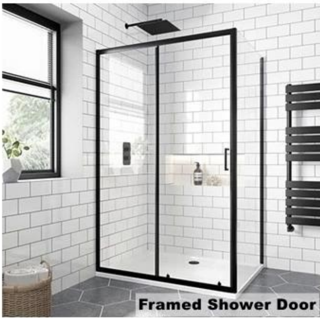
Framed Shower Door