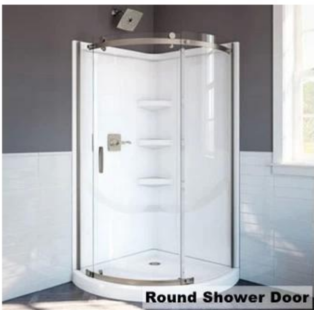
Round Shower Door