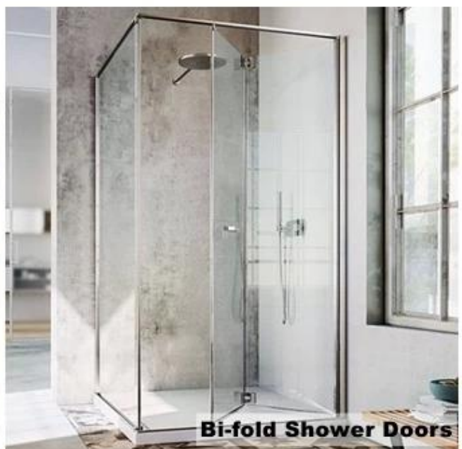
Bi-fold Shower Doors