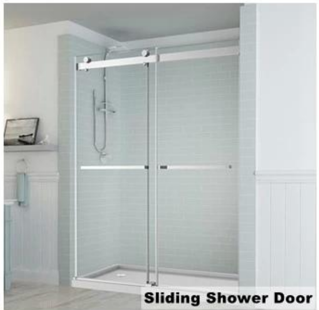
Sliding Shower Door