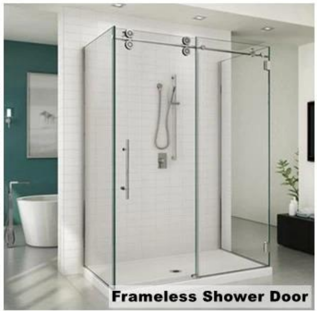
Frameless Shower Door