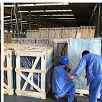
Packing & Loading