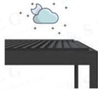
regulation of temperature