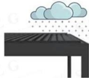
durable for snow