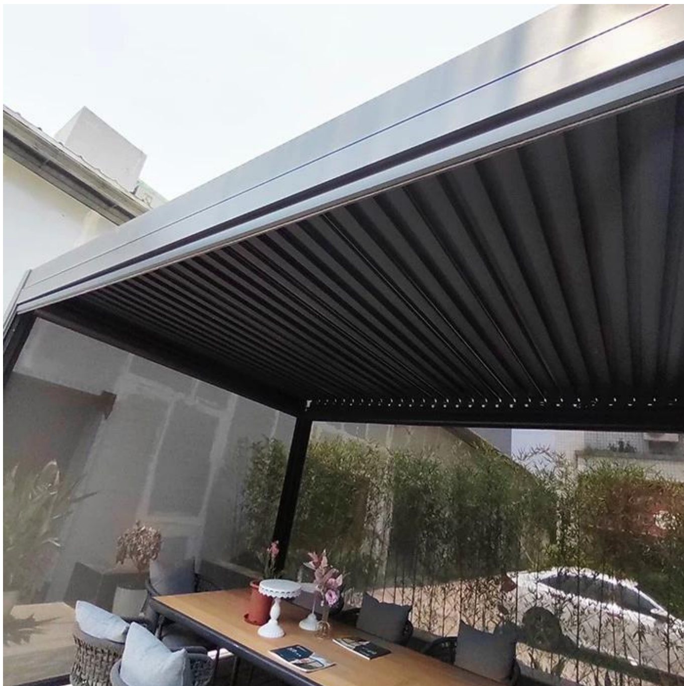
Dettagli di pergola a cerniera