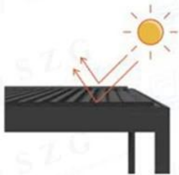
protection from the sun