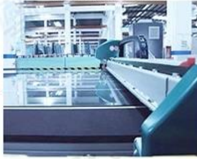
Edgeworks & Drilling