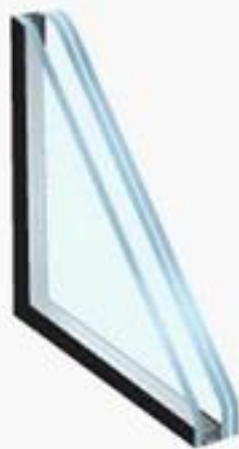
Insulated Laminated Glass