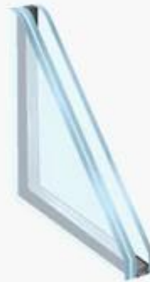
Laminated Insulated Glass