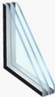
Triple Insulated Glass