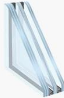
Triple Laminated Insulated Glass