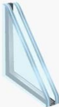
Double Laminated Insulated Glass