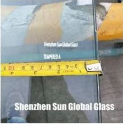
Shenzhen Sun Global Glass