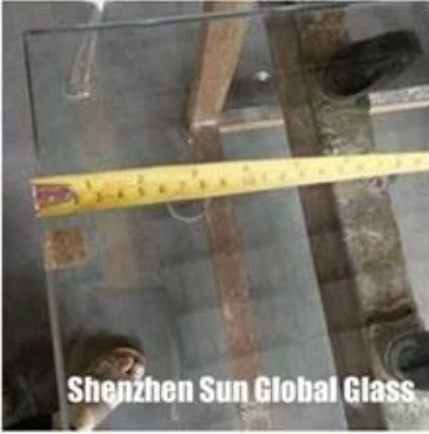
Shenzhen Sun Global Glass