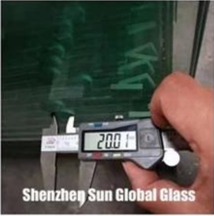
Shenzhen Sun Global Glass