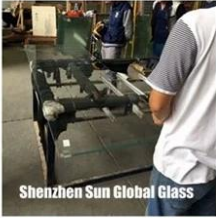
Shenzhen Sun Global Glass