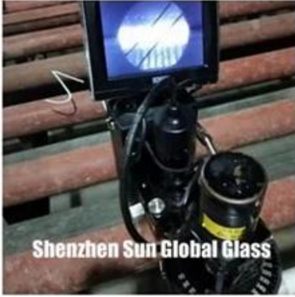
Shenzhen Sun Global Glass