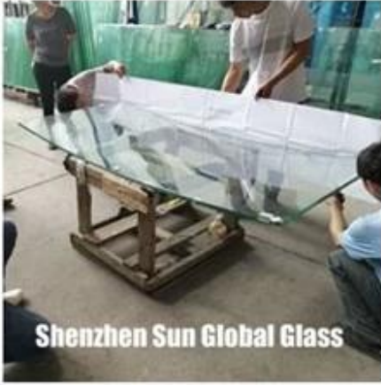
Shenzhen Sun Global Glass