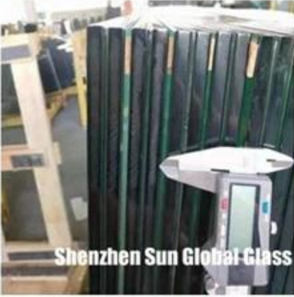
Shenzhen Sun Global Glass