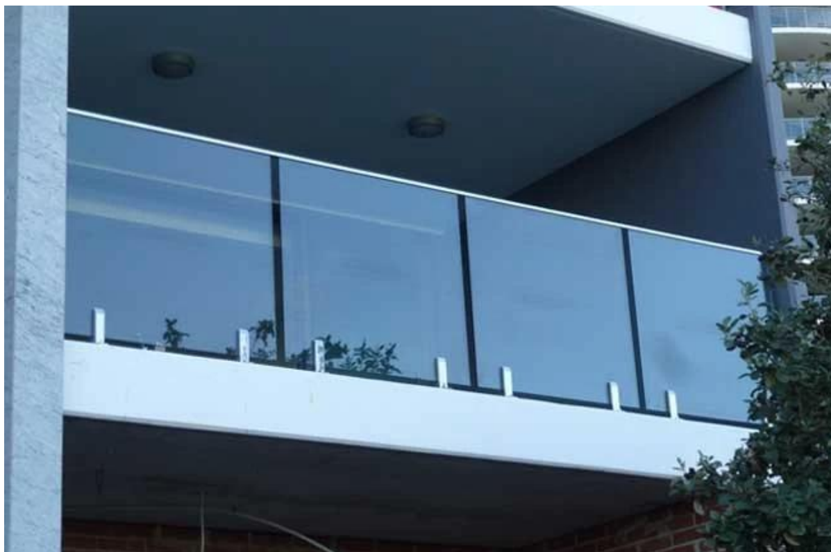
Wszystkie balustrady szklane bezramowe ze szkła balustrady