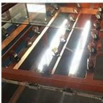
LED Lighting Detection