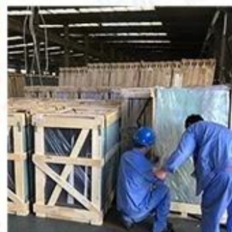
Packing & Loading