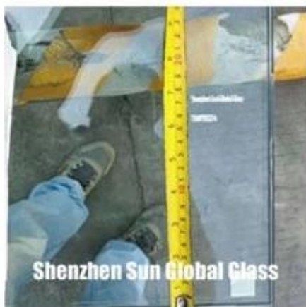
Shenzhen Sun Global Glass