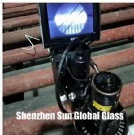
Shenzhen Sun Global Glass