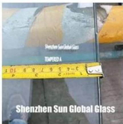
Shenzhen Sun Global Glass