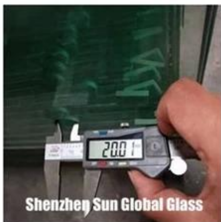
Shenzhen Sun Global Glass