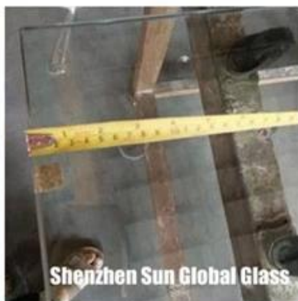
Shenzhen Sun Global Glass