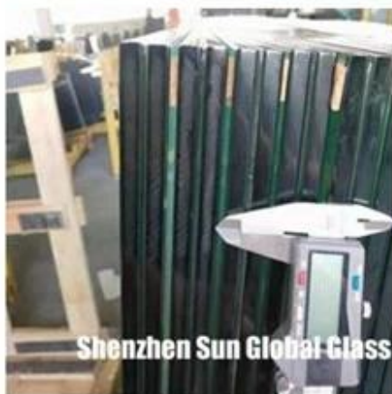
Shenzhen Sun Global Glass