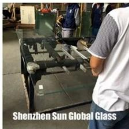
Shenzhen Sun Global Glass