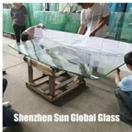
Shenzhen Sun Global Glass