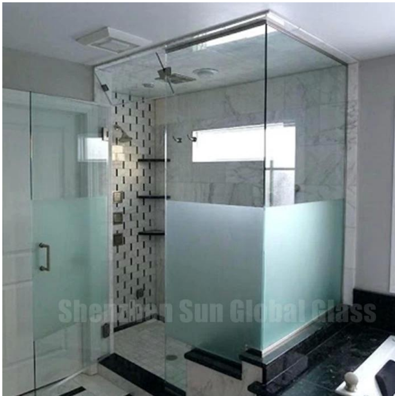
Portas de banheiro sem moldura para portas de vidro fosco de 12 mm / de privacidade: