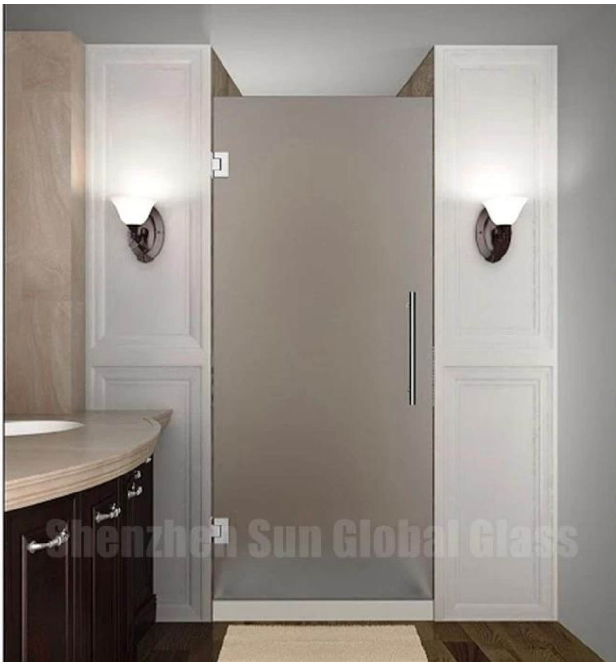
5. Tipo de porta fixa de portas de chuveiro fosca de 12mm / anexo u res