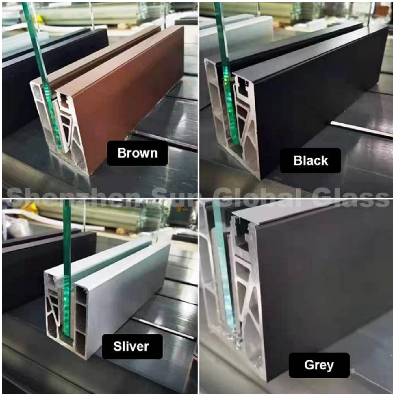
Canal de alumínio u com luz led