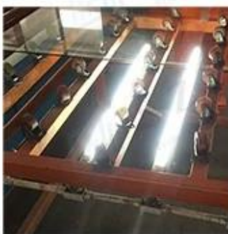
LED Lighting Detection