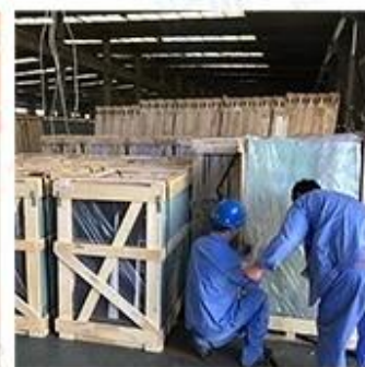
Packing & Loading