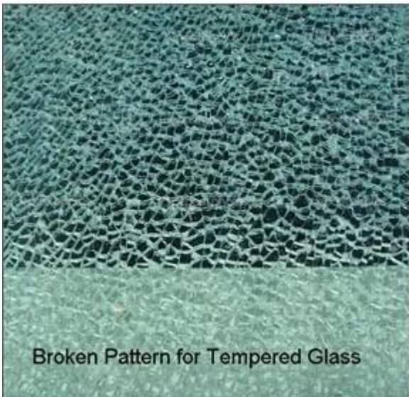
Broken Pattern for Tempered Glass