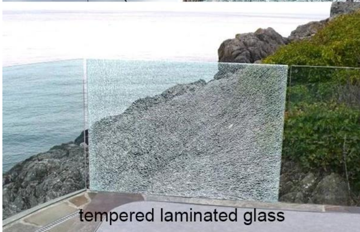
tempered laminated glass