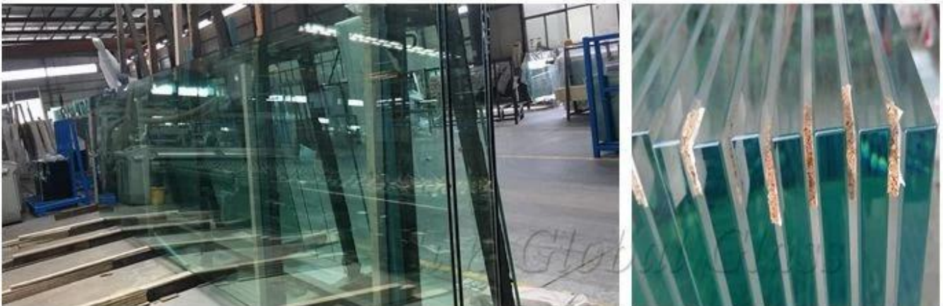
Produção de vidro de efeito estufa: