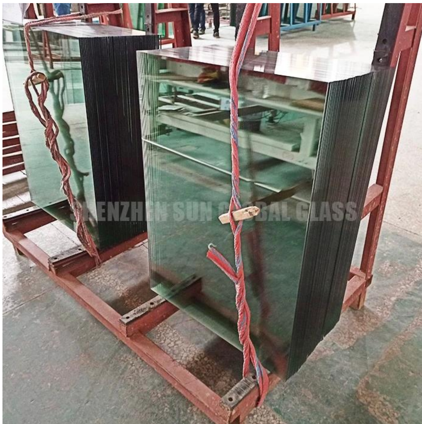
Tipo de destaque

de compressão, e o interior Em um estado de tensão. Devido a essas tensões mecânicas, as quebras de vidro temperadas em pedaços granulares, em vez de fragmentos com bordas afiadas, reduzindo a chance de ferimentos. Vidro temperado também é conhecido como vidro temperado ou vidro de segurança.