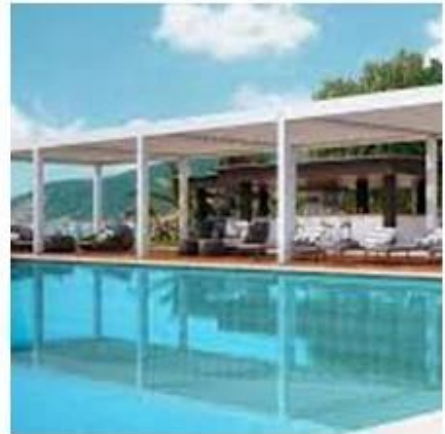
detalhes de pérgola de telhado persiana