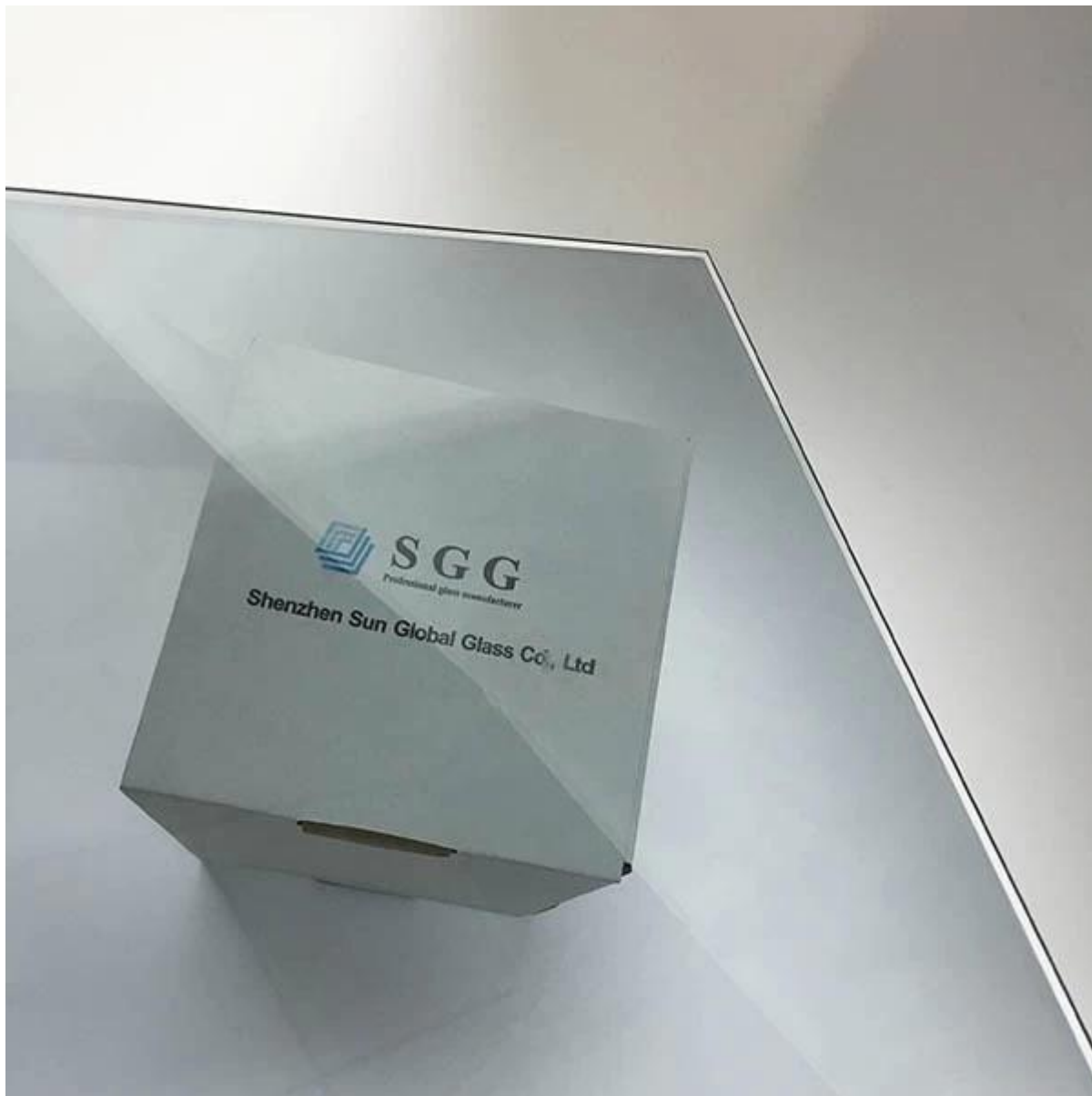
Пакет 10.38 мм low-e laminated стекла: