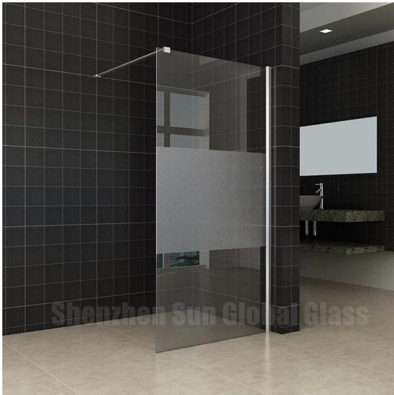
Обрамленный / полурамный тип для дверей ванной комнаты с матовым стеклом 12 мм: