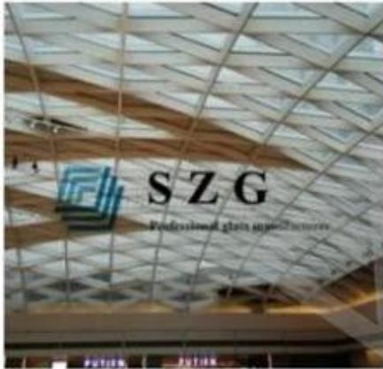
China Resources Mall Low E Insulated Glass Roofing

17.52mm High Transparent Low E laminated Glass+20A+ 17.52mm Low Iron Tempered Laminated Glass, Irregular shapes, 8000m 2