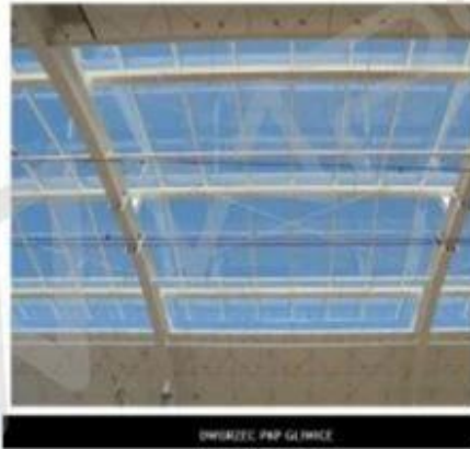
Poland-PKP Gliwice Train Station Skylight project

17.52mm High Transparent Low E laminated Glass+20A+ 17.52mm Low Iron Tempered Laminated Glass, Irregular shapes, 8000m 2