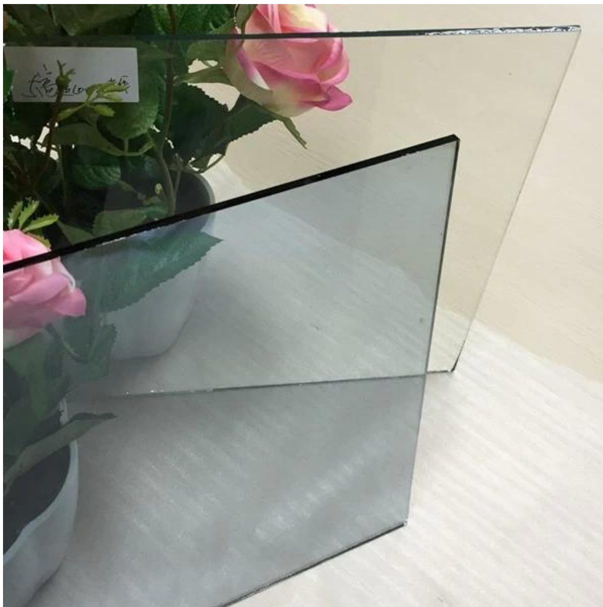
Пакет Low-E glass Китай завод: