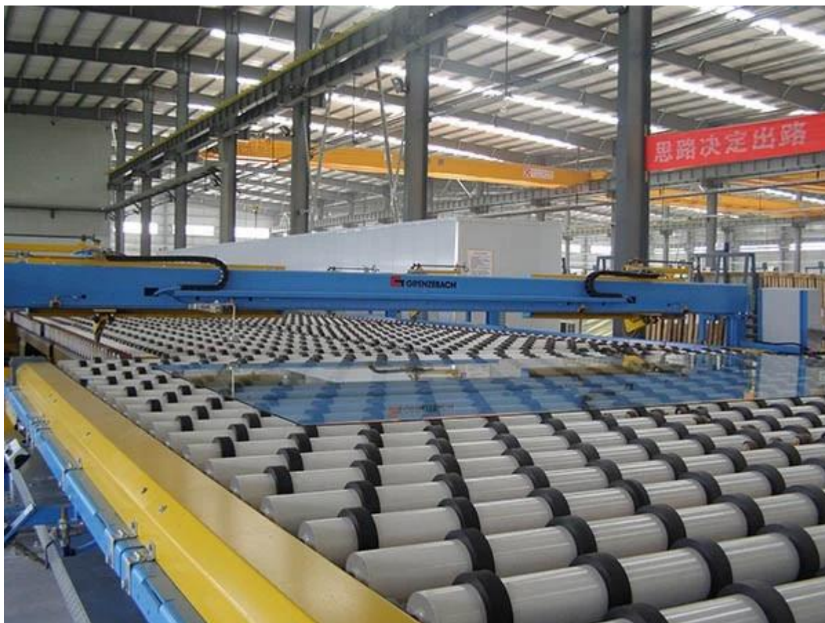
Пакет и загрузки: