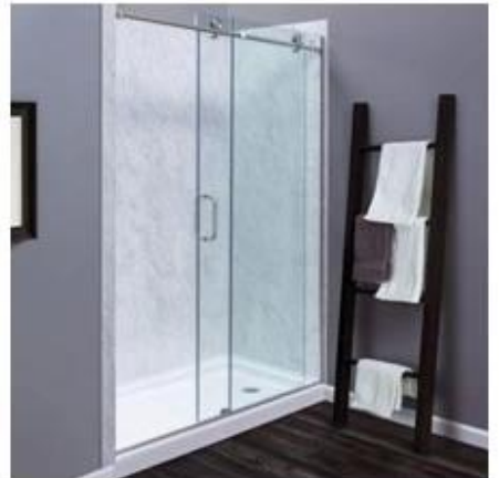
Аксессуары из стеклянной душевой двери