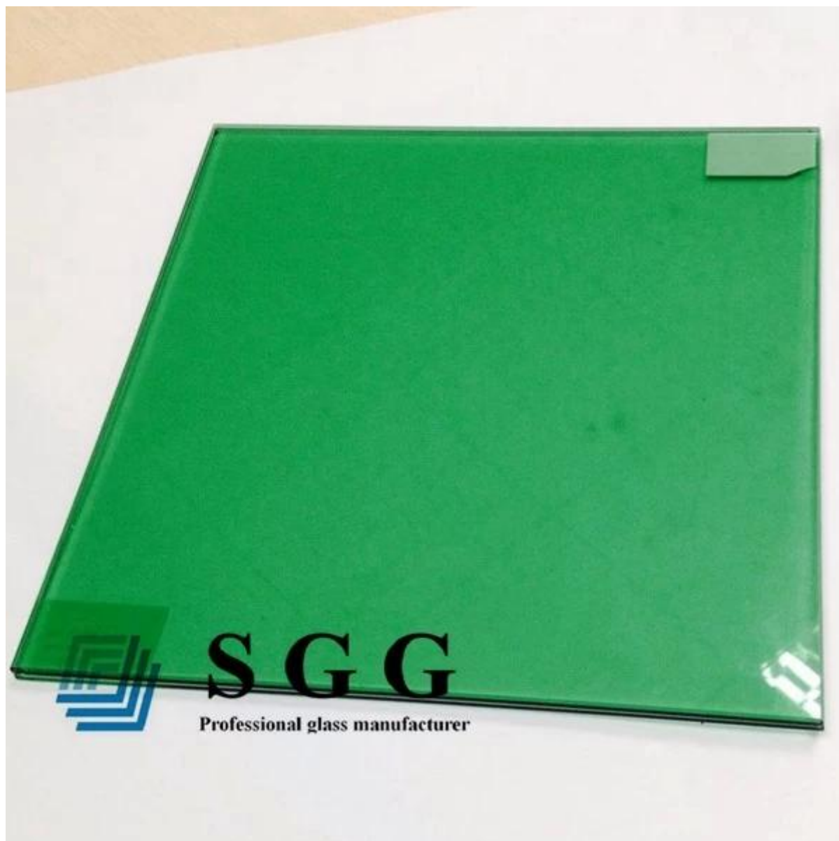
Рисунок 8 мм упрочненное стекло: