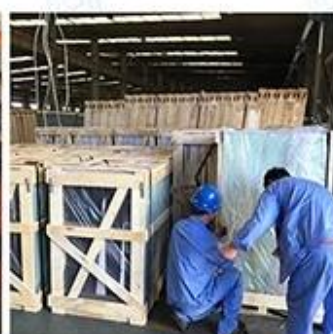
Packing & Loading