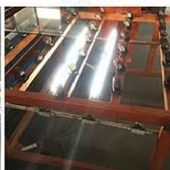
LED Lighting Detection