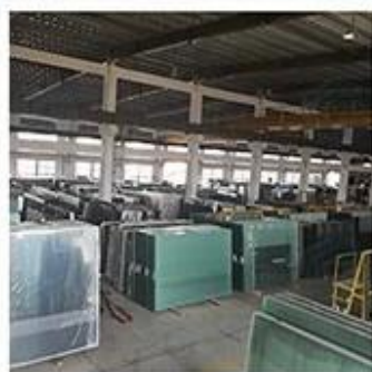
Material Storage Area

машина, печь для закалки, линия по производству стеклопакетов и т. Д. Например, для стеклопакетов ежедневная производительность составляет 5000 м 2 ; закаленное стекло суточная производительность 13000м 2 ; многослойное стекло суточная производительность 8000м 2 и др.