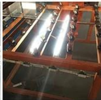
LED Lighting Detection