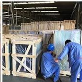
Packing & Loading