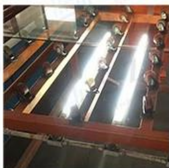
LED Lighting Detection