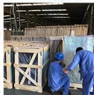
Packing & Loading