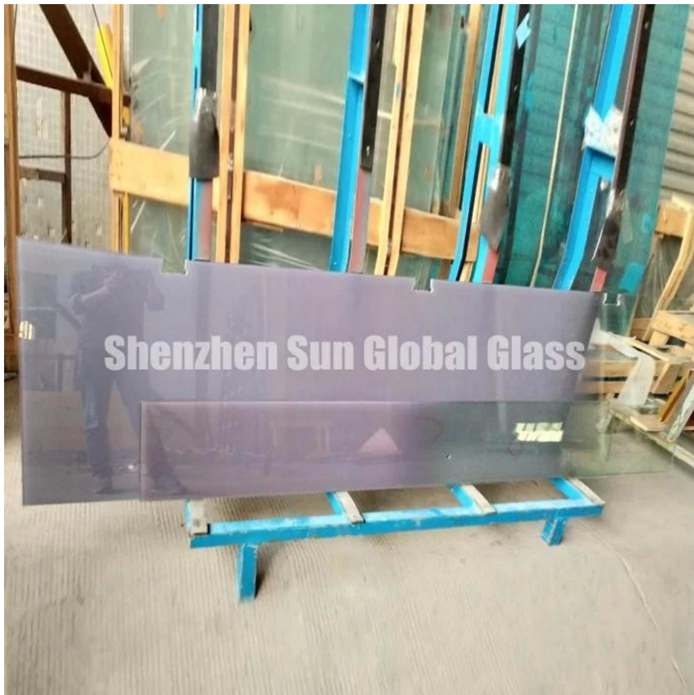
Упаковка и загрузка: