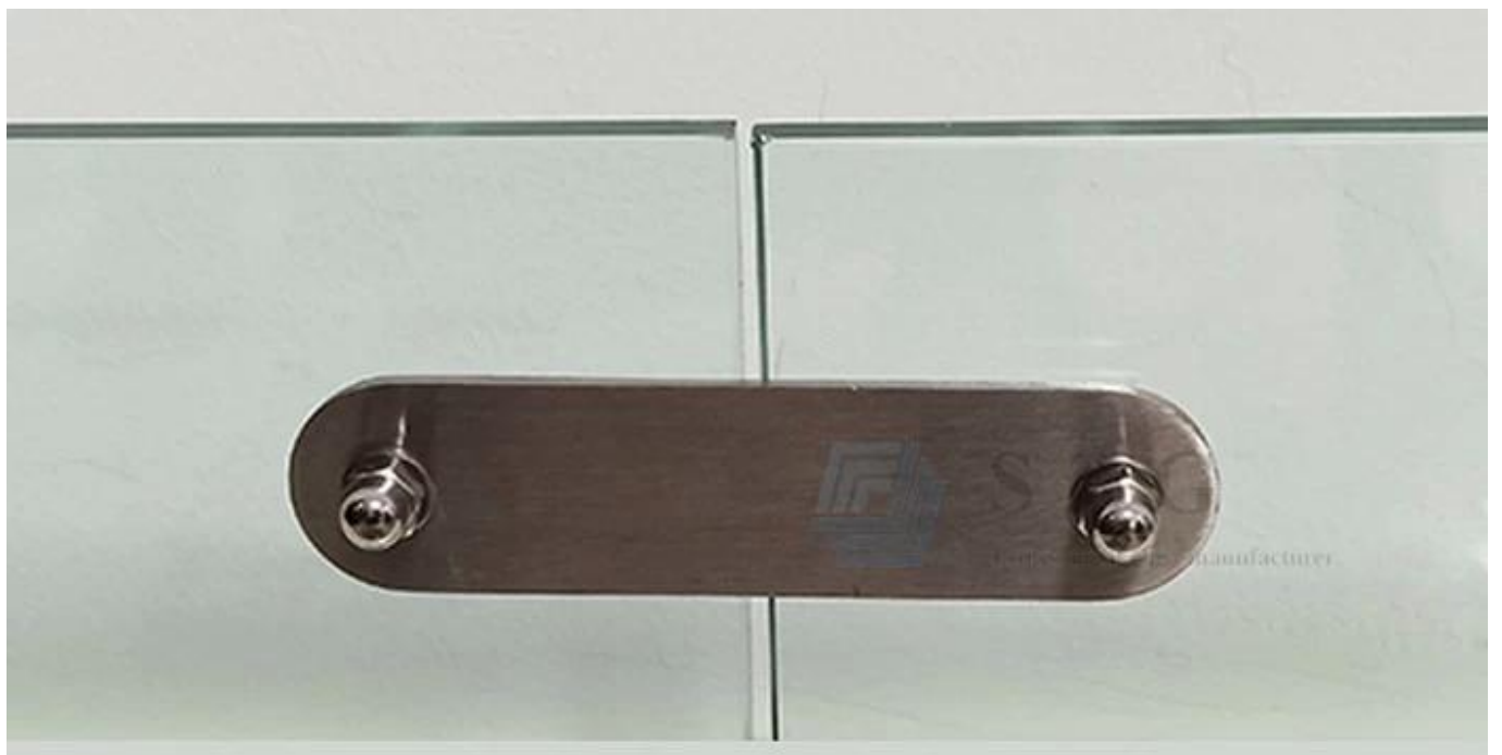
Turf nhân tạo cho Tòa án Padel