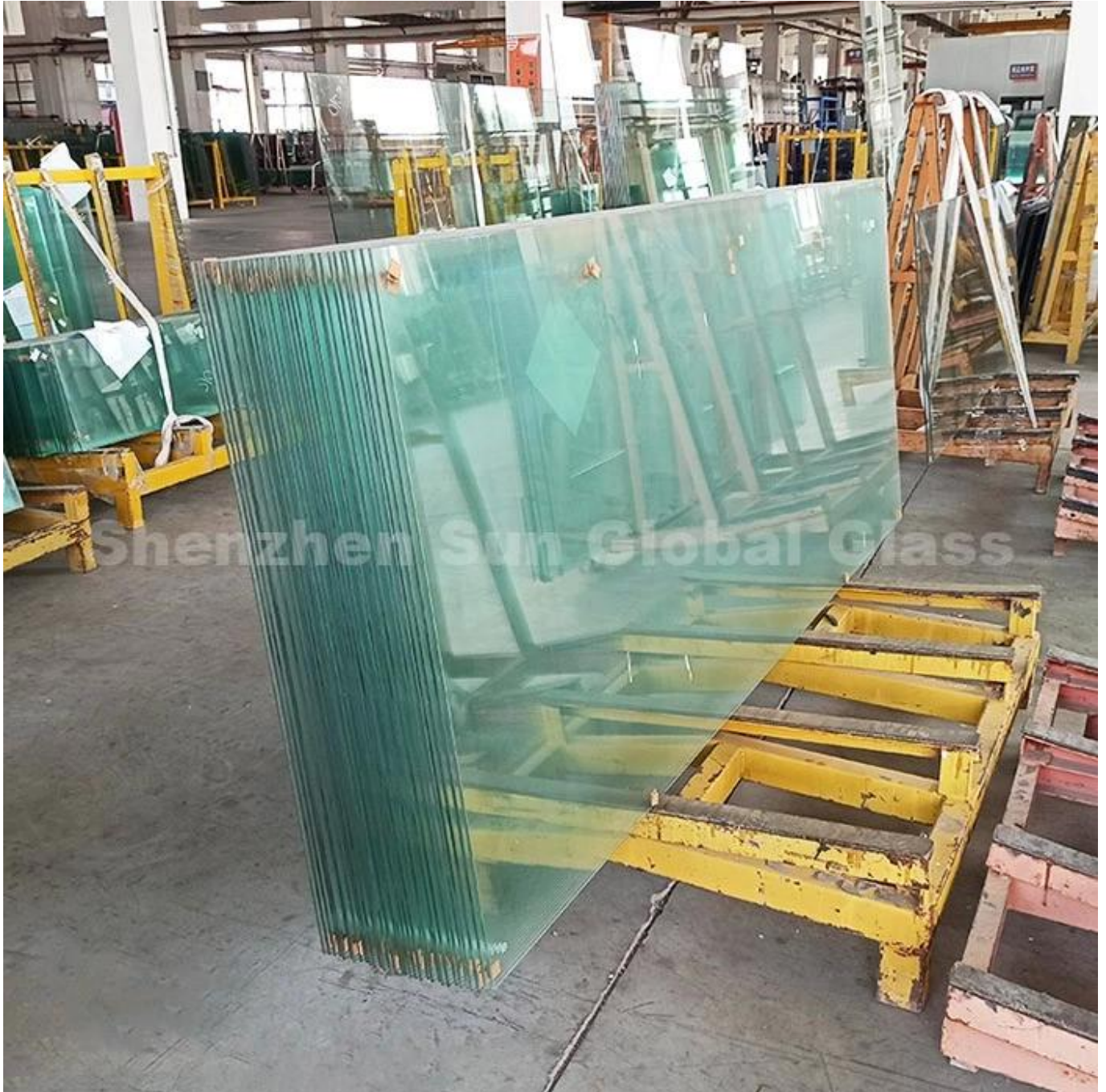
Phụ kiện cho cửa tắm trượt

Kính cường lực 10 mm thường được làm bằng cách làm nóng kính nổi 10 mm gần điểm mềm và sau đó nhanh chóng làm mát nó bằng cách sử dụng không khí áp lực cao. Điều này làm cho kính mạnh gấp năm lần so với tấm kính truyền thống. Không chỉ có khả năng chống va đập kính cường lực, nó cũng vỡ thành những miếng nhỏ, tròn. Hiệu ứng vỡ vụn này làm giảm nguy cơ chấn thương nghiêm trọng nên rất thủy tinh. Một lợi ích khác là kính cường lực có khả năng chịu nhiệt nhiều hơn kính truyền thống, làm tăng thêm lợi ích nhiệt cách nhiệt bên trong vòi hoa sen của bạn để thoải mái tối ưu.