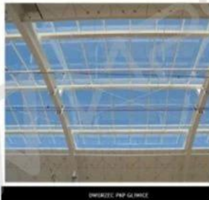
Poland-PKP Gliwice Train Station Skylight project

17.52mm High Transparent Low E laminated Glass+20A+ 17.52mm Low Iron Tempered Laminated Glass, Irregular shapes, 8000m2