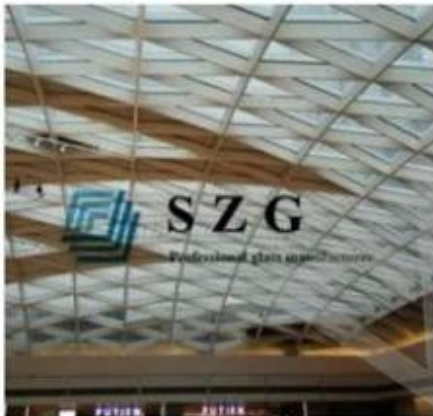
China Resources Mall Low E Insulated Glass Roofing

17.52mm High Transparent Low E laminated Glass+20A+ 17.52mm Low Iron Tempered Laminated Glass, Irregular shapes, 8000m2