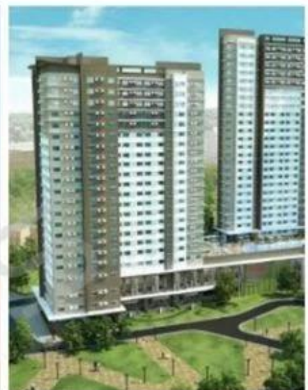
Avida Towers Altura

8+12a+8 low e insulated glass for Eastfield project. 32000m2