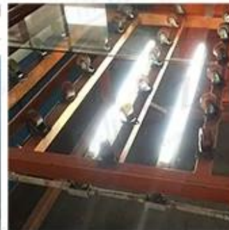
LED Lighting Detection