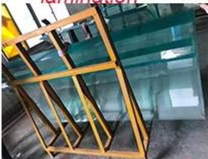
product come out