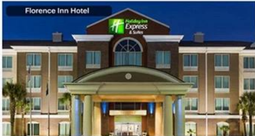
Florence Inn Hotel