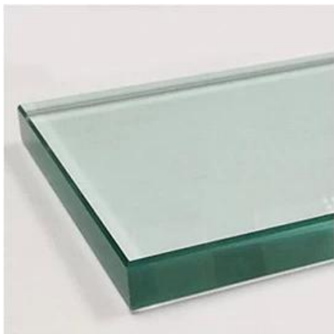
Clear Tempered Glass