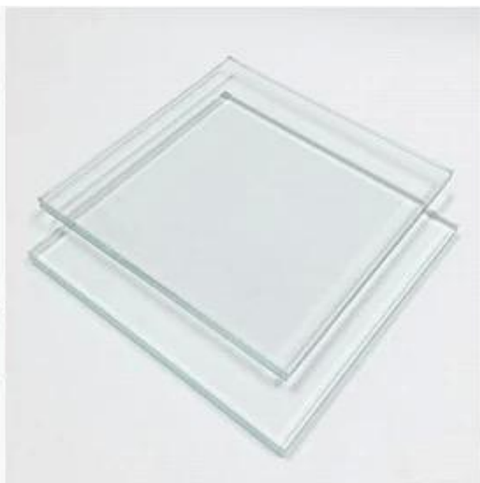
Ultra Clear Tempered Glass