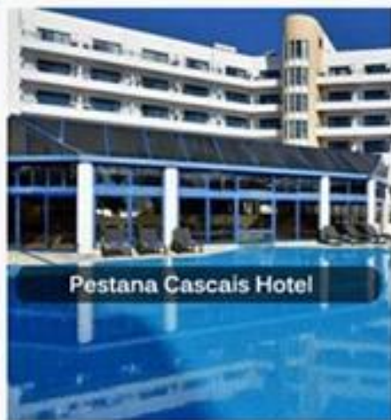
Pestana Cascais Hotel