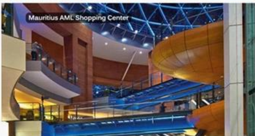
Mauritius AML Shopping Center