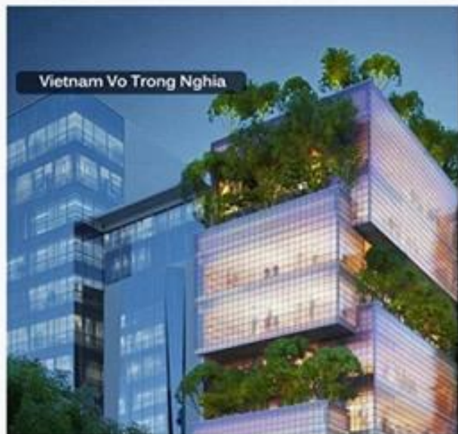
Vietnam Vo Trong Nghia