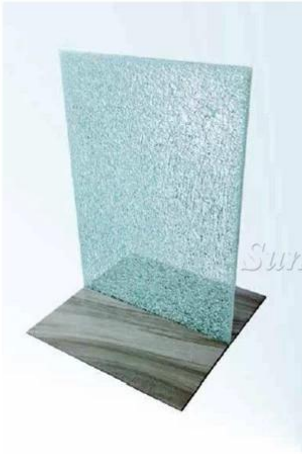
12mm Laminated Glass with SGP Interlayer