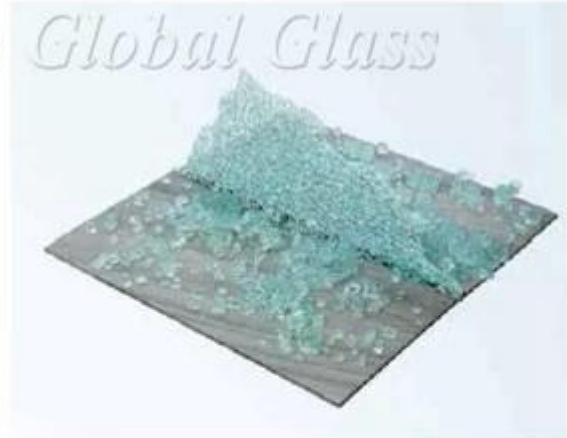
12mm Tempered Glass