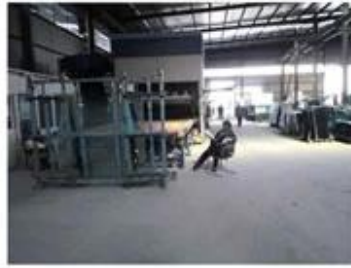
High-pressure & Cleaning