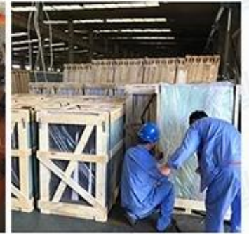
Packing & Loading