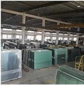
Material Storage Area