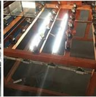
LED Lighting Detection