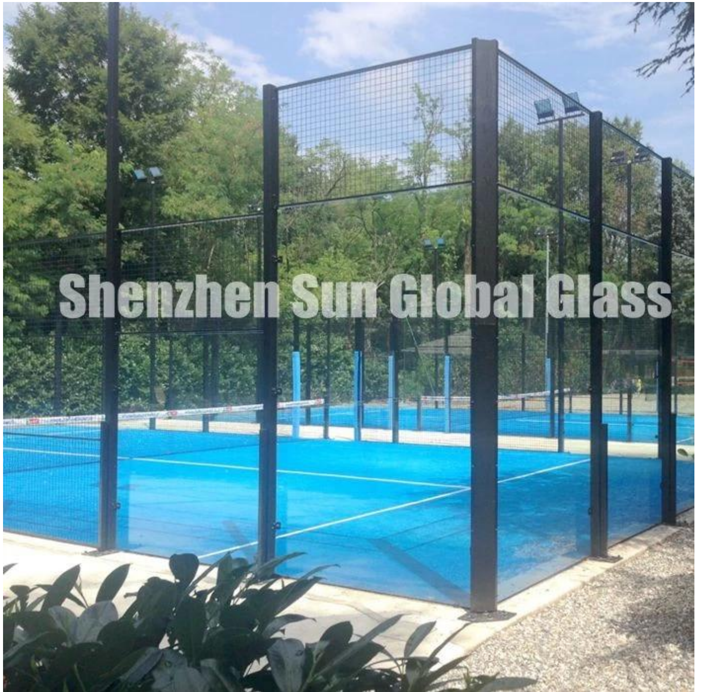
Hình ảnh của kính dán cường lực trong suốt 13,52mm: